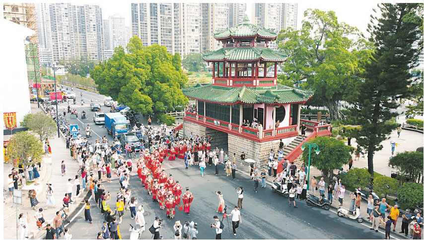
揭阳大力推进古城保育活化

揭阳以“拔杆、拆围、增绿、硬化”为关键抓手,深入推进绿美广东生态建设,全域提升城乡风貌,实现了村村通光纤,农村规模化供水覆盖率达93%以上,村内道路硬化率达96%,农村生活污水治理率达100%,森林覆盖率提升至51%,139个高速出入口及重要交通节点蝶变升级。揭阳还打造出1500公里沿主干道串联镇带村成片风貌带,成为城乡面貌实现可