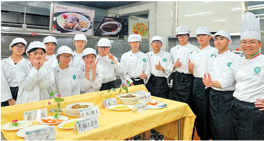
学生期末实操考试作品展示

“每次完成作品,都觉得特别有满足感。”参与考试的学生纷纷表示,在食品工程学院学习,不仅能掌握一门实实在在的手艺,提升专业技能,更能将所学运用到生活中,为家人制作可口的