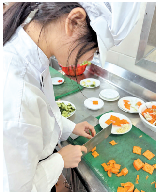
刀工考试

从香甜的烘焙点心到精致的中式菜肴,从创意特调到匠心汤品,一场期末实操考,不仅是对学生一学期学习成果的检验,更展现了职业教育注重实践、培育技能型人才的初心。学生在实操中成长,在实践中收获,一门门扎实的手艺,不仅成为他们未来职业发展的底气,更让职业教育的活力与魅力尽情绽放。