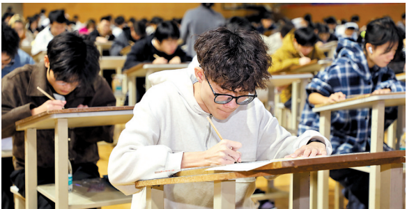
机械制图比赛