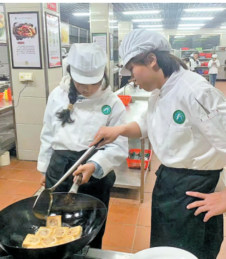
火候控制专项考试

在评分标准上,学院采用非常好、好、一般、差、极差5个可量化等级,让考核更公平、更精准。以汤品考核为例,汤色是否与蔬菜本身色泽保持一致,是重要的评分依据,达到标准即可获得满分;味道评定则结合学生提前制定的菜谱,评判咸鲜、香辣等预设口味的还原度,兼顾规范性与创新性。