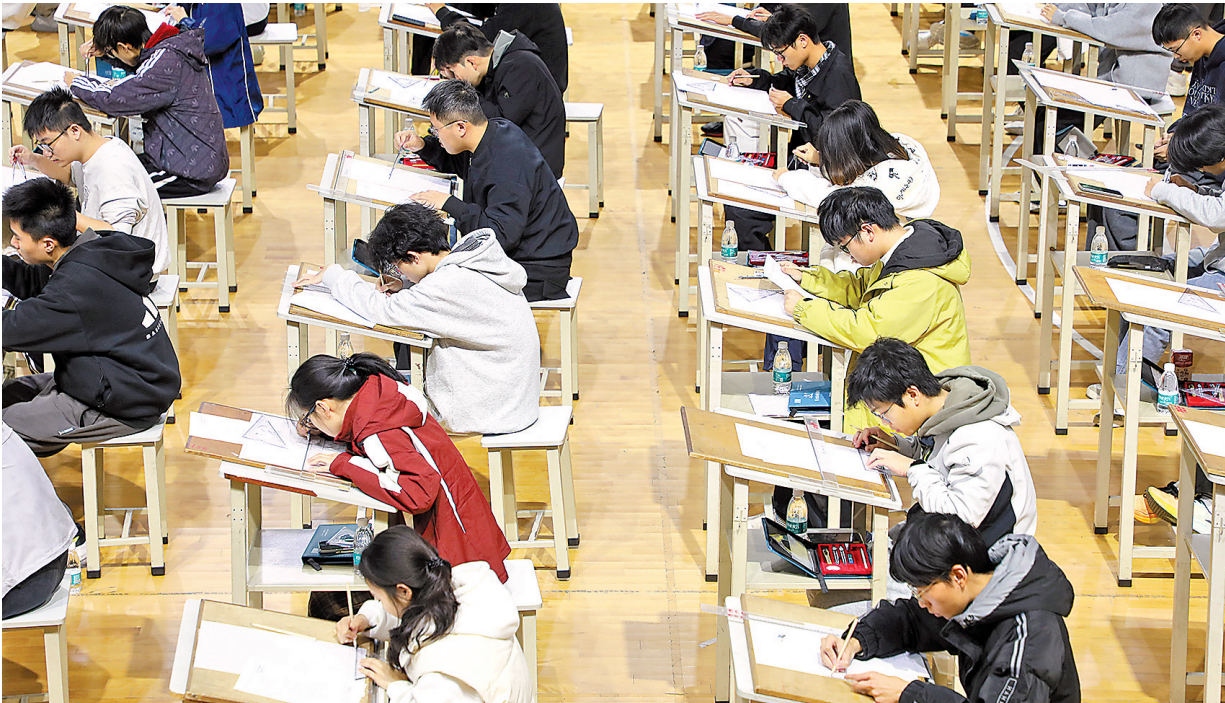
广轻大智能制造与装备学院首届本科生“智造杯”技能大比武现场

这是广轻大智能制造与装备学院首届本科生“智造杯”技能大比武的生动一景。在这里,考题反映了企业真实需求,评判由校企共同完成。有优秀学子凭借扎实表现,当场获得企业录用意向,提前锁定职业发展通道。