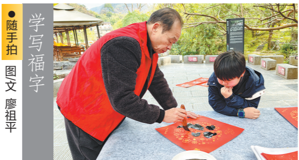
● 随手拍 图文 廖祖平

新年快到了,在广西壮族自治区昭平县黄姚镇,一名小学生在看老师用毛笔写“福”字,那专注的神情透出学习的渴望和对传统文化的向往。