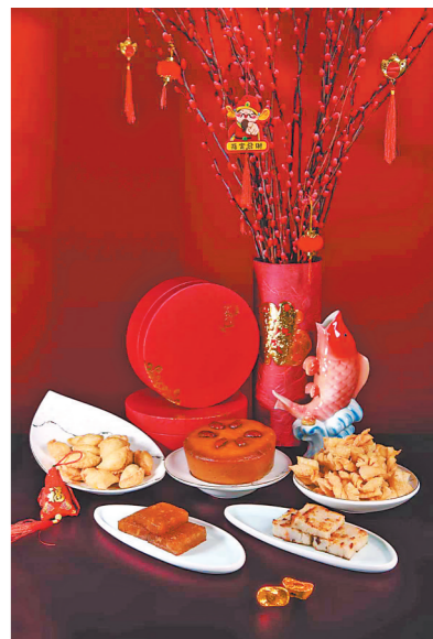
新年食品样样喜庆