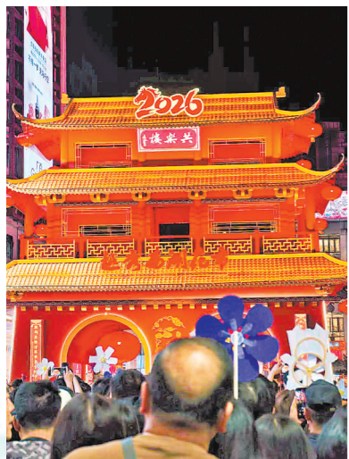
共乐楼前人头攒动