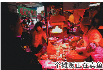
一个摊贩正在卖鱼