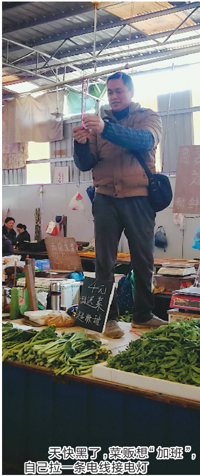
天快黑了,菜贩想“加班”,自己拉一条电线接电灯