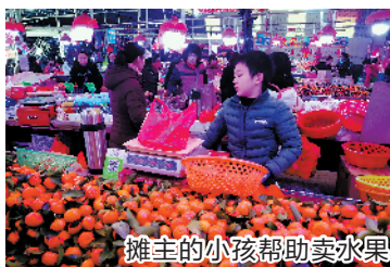
摊主的小孩帮助卖水果