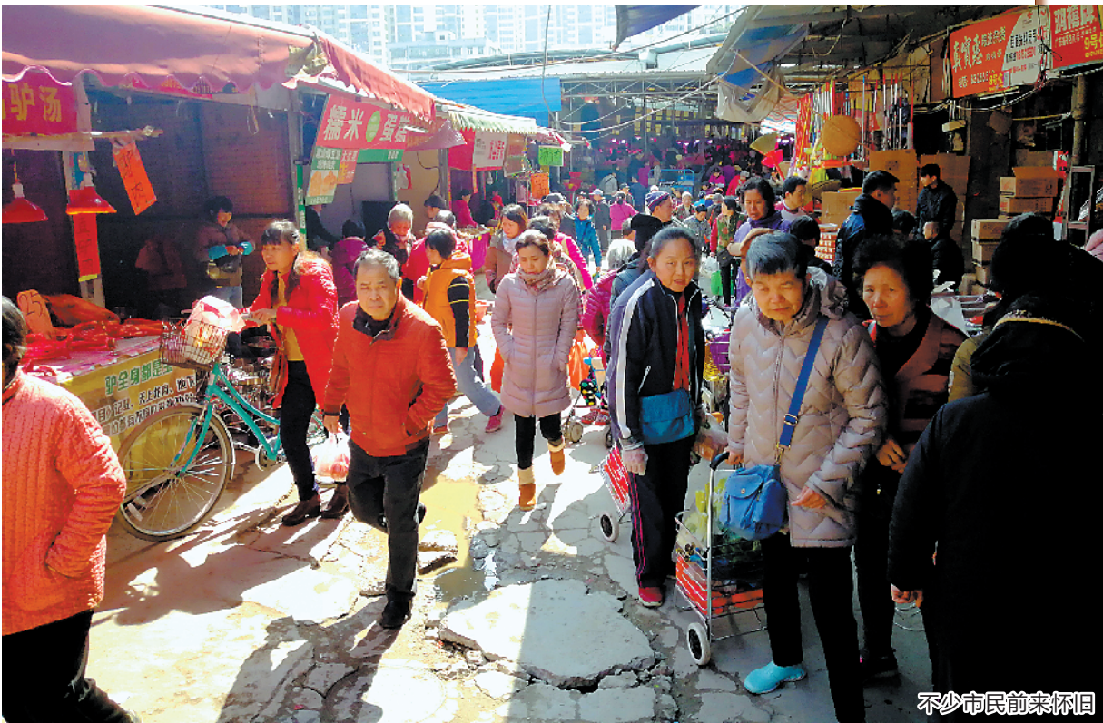
不少市民前来怀旧