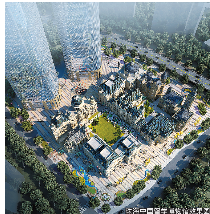
珠海中国留学博物馆效果图

中国留学史专家、江苏师范大学留学与近代中国研究中心主任周棉认为，一个国家文博事业的发展如何，是这个国家文化和文明程度的标志之一。近代中国百年留学运动在近代中国