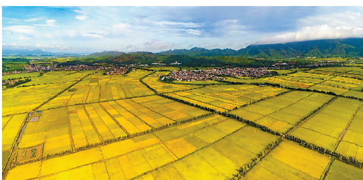
台山中国农业公园中的禾海稻浪景观

田文化主题园面积超万亩，计划投资超亿元，将打造集农业示范、农耕体验、科普教育、旅游观光、休闲娱乐、温泉度假于一体的水稻田生态文化主题园。据悉，该项目划分八大功能分区，分别为人口综合服务区、岭南农耕文化区、稻田主题游乐区、田园养生养老区、乡村文化休闲区、禾海温泉度假区、生态农业展示区、万亩稻田示范区，打造成广东首个水稻主题园。目前，该项目已投入资金超过3500万元，首期工程已完成园区首期绿化工程、河道清淤排障工程的建设，入口牌坊的牌匾还特别邀请了袁隆平院士题字——“台山中国农业公园”，观景平台则可俯瞰“广东第一田”壮观的农耕景象。