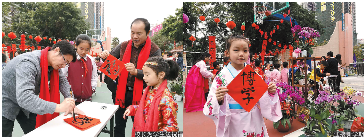
校长为学生送祝福