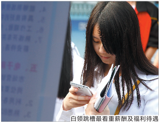
白领跳槽最看重薪酬及福利待遇