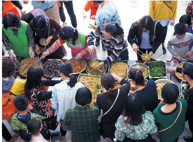
石排镇赤坎社区素食日是社区居民共同的节日

羊城晚报讯 记者谢颖、通讯员王琰玢摄影报道:在东莞石排镇赤坎社区,每个月的农历初一,社区中心里就会齐聚200多名社区居民,一起共同享用一顿免费的素食大餐。