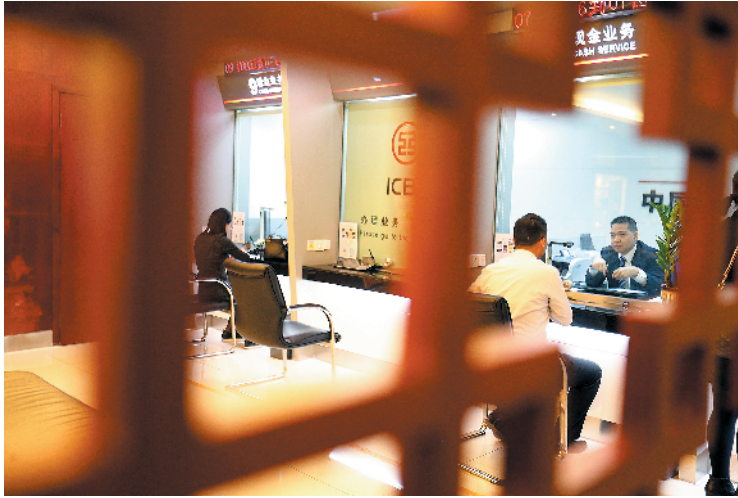
各银行积极创新改进业务流程，健全小微企业贷款风险管理机制