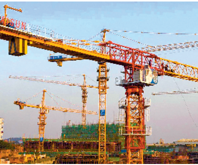
毅新塔机犹如巨人屹立

中堂镇凤冲村东至湛翠，西至鹤田，南临东江南支流与高埗镇村隔江相望，北是南潢路贯穿村边。若在新工业开发区附近观察，不难发现，打着“毅新”特有标识的大型塔机正屹立在广阔的产区之中，远远望去，犹如“超级巨人”般巍然不倒。