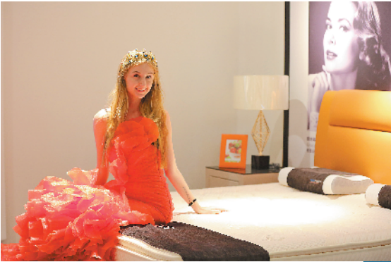
东莞一家床垫企业请外国模特为产品宣传。如今，东莞已有370家企业“走出去”

东莞外贸进出口总额已经连续15年保持全国第五！昨天下午，东莞举行全市商务工作会议，今年，东莞将全面构建“引进来”和“走出去”双向促进机制，拓展对外开放新空间，当前东莞正积极制定“东莞外资十条”，促进新一批大项目落地。截至目前，东莞已经共有370家企业“走出去”，投资总额超过11.6亿美元。