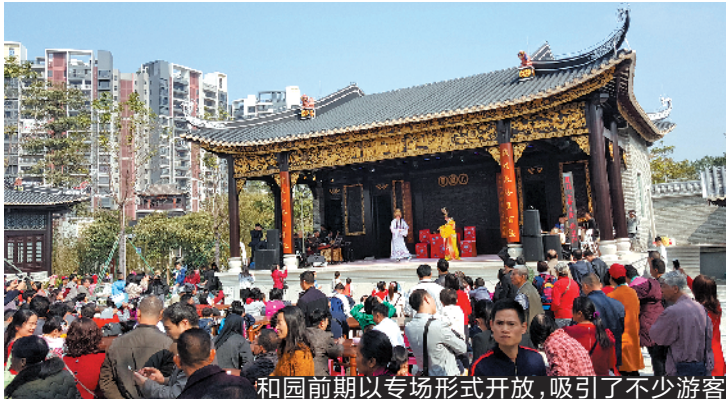
和园前期以专场形式开放,吸引了不少游客

羊城晚报讯 记者张韬远报道:备受各界关注的顺德和园终于确定本月正式开园。根据日前发布的《关于顺德和园门票政策及相关事宜的公示》,顺德和园将于本月 29 日(周日)正式开园,经和园管理方研究,拟收取全票价格 50 元(2018 年暂执行优惠价全票 30 元),对顺德区范围居民游览和园则采取“免费不免票”方式。目前该事项前期已征求政府各级部门意见,并形成《北滘和园门票对顺德居民免费管理规定》(以下简称《规定》)。