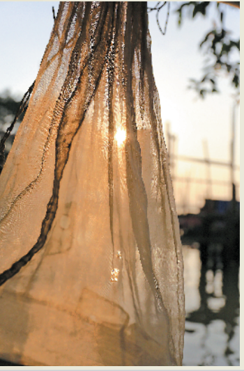
渔民们晾晒的纱布