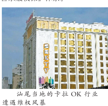
汕尾当地的卡拉OK行业遭遇维权风暴

据了解，为了在全社会形成保护知识产权的良好氛围，防止卡拉OK行业新一轮维权风暴的到来，汕尾法院已在今年初向汕尾市文广新局发出司法建议，提出加大普法宣传和行政监管力度、搭建信息公开平台、建立行业协会等多项建议措施。目前，汕尾市文广新局也给予了积极回应，要统筹协调社会各界力量，将权利人、卡拉OK经营者团结起来，在市场运营、行政管理、集体管理、司法保护等多方面的支持下，建立全方位、立体化的卡拉OK音乐版权保护体系。