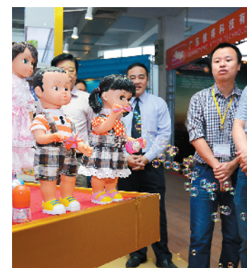
每一届玩博会都会吸引众多客商前往采购

记者获悉，今年的玩博会亮点颇多。届时，开幕现场不仅有机器狗机器人联合表演、中国玩具产业协会“20+企业战略合作”签约仪式，而且还将举办“4·28”澄海玩具节欢乐购活动启动仪式和国家级“澄海出口玩具质量安全示范区”揭牌仪式等活动。