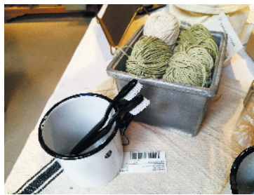
以前常见的搪瓷杯