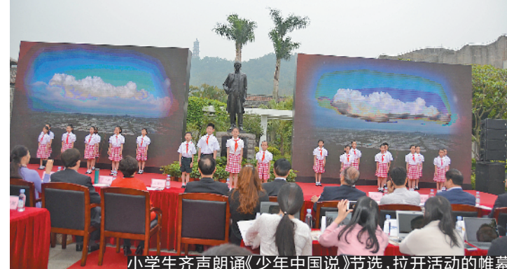
小学生齐声朗诵《少年中国说》节选，拉开活动的帷幕

羊城晚报讯 记者彭宇宁、通讯员谭耀广、王丽摄影报道：4月18日，由江门市委统战部、市委宣传部指导主办的“少年中国说”粤港澳大湾区及海外华裔青少年文化交流品牌活动全球新闻发布会暨启动仪式在广东江门新会区茶坑村梁启超故居举行。江门市委统战部、宣传部及嘉宾学者等500多人参加了活动。