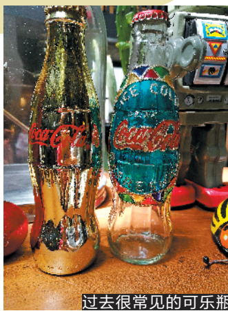
过去很常见的可乐瓶