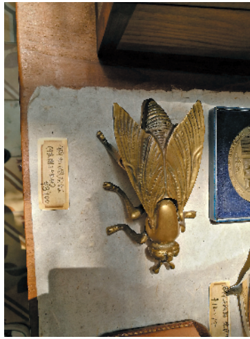
动物造型的烟灰缸