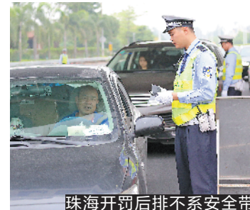
珠海开罚后排不系安全带