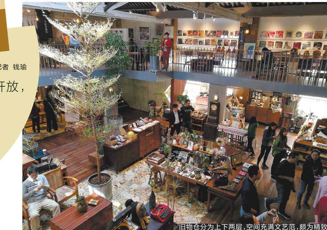
旧物仓分为上下两层，空间充满文艺范，颇为精致