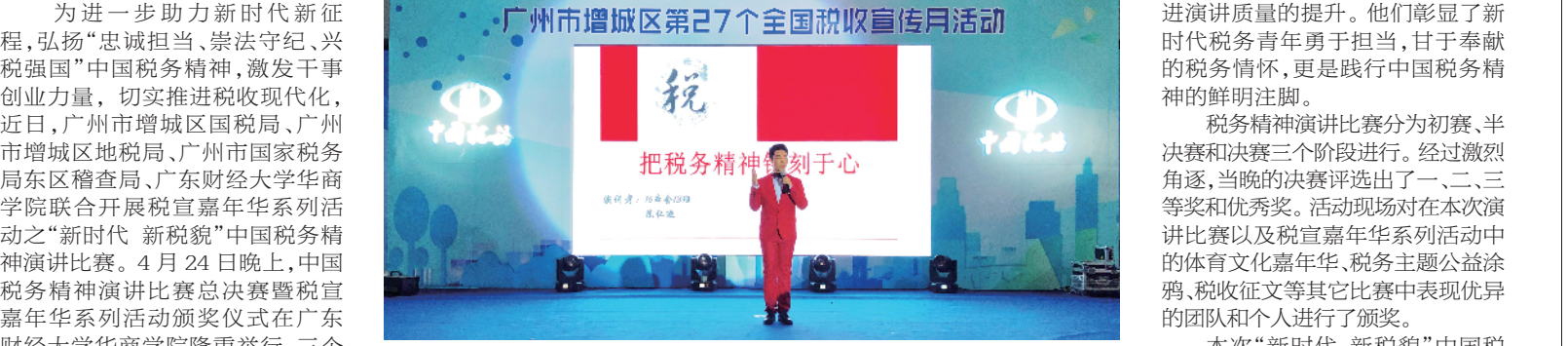
广州市增城区第27个全国税收宣传月活动之“中国税务精神”演讲比赛总决赛现场

广州市增城区国家税务局、广州市增城区地方税务局、广州市国家税务局东山区稽查局、广东财经大学华商学院联合举办中国税务精神演讲比赛