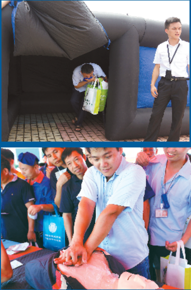
市民参加大鹏新区安全生产月活动 (资料图片)

6月6日下午，大鹏新区2018年“安全生产月”活动正式启动。接下来，大鹏新区将通过开展多种形式的安全宣传活动、行业特色主题安全宣传周活动、安全应急预案演练活动、