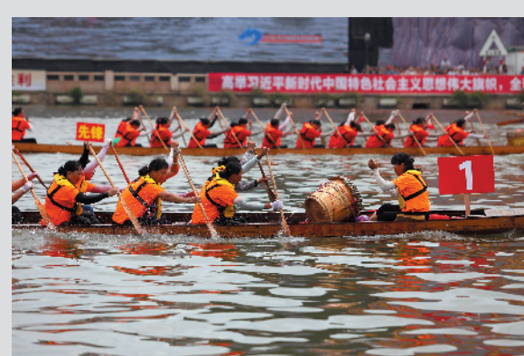
中帼不让须眉

羊城晚报讯 记者余晓玲报道：湖中桨影翻飞，两岸欢声雷动——每年农历五月十二举行的沙田龙舟活动，是东莞龙舟赛的重要一景，也是沙田人翘首企盼的体育盛事。6月25日上午，我们的节日——2018年沙田镇龙舟锦标赛在沙田淡水湖震撼上演。来自该镇各村（社区）的17条男子传统龙舟和17条女子标准龙舟展开精彩竞速。据了解，作为中国龙舟协会授予的全国首个“龙舟之乡”，龙舟运动在沙田镇有着深厚的群众基础，各村都有男、女龙舟队。从上世纪80年代中期开始，沙田镇在每年农历五月十二举行龙舟赛事，该镇曾多次举办重大龙舟赛事，如1997年第二届“炎黄杯”世界华侨华人龙舟系列赛东莞赛区赛事、2012年沙田水韵文化节粤港澳龙舟邀请赛等。沙田男、女子龙舟队也曾多次在国内外重大赛事中夺魁，先后获得过亚洲龙舟锦标赛、香港国际龙舟赛、世界龙舟锦标赛桂冠。