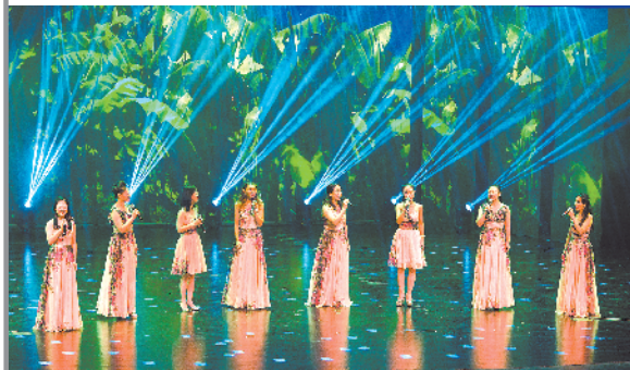
女声小组唱《幸福哭嫁唱不完》

了近年来东莞市群众文艺创作的最高水平。市文化馆相关负责人表示,本次文艺精品惠民巡演组织的节目,都是近年来荣获国家“群星奖”、“牡丹奖”、大型音乐展演金奖以及在全省花会、年度文艺作品评选中斩获佳绩的优秀作品,希望可以通过巡演,充分发挥优秀作品示范引领作用,为基层群众送去更多更好的精神食粮。