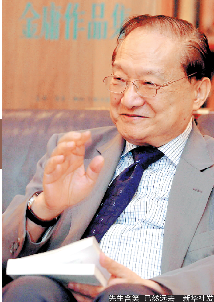
先生含笑 已然远去

崇焕。”(注:1975年金庸写《袁崇焕评传》时,东莞还是县,这也是金庸写的第一篇历史人物评传。)(在《袁崇焕评传》中,金庸力赞袁崇焕是真正的英雄,“大才豪气,笼罩当代,即使他的缺点,也是英雄式的惊世骇俗。他比小说中虚构的英雄人物,有更多的英雄气概。”