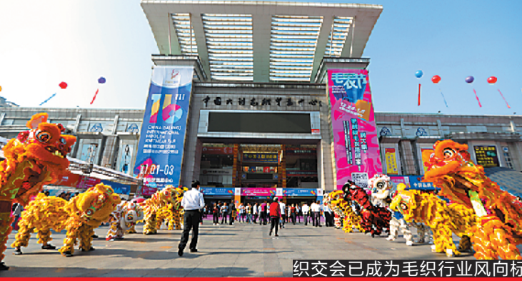
织交会已成为毛织行业风向标

东莞市大朗镇不产一根羊毛,却缔造了以大朗为中心的毛织产业集群,每年生产8亿件毛衣,温暖了全世界。而作为大朗毛织交易的一个重要平台和载体,第十七届中国(大朗)国际毛织产品交易会(以下简称“织交会”)将于11月3-5日盛装迎客。