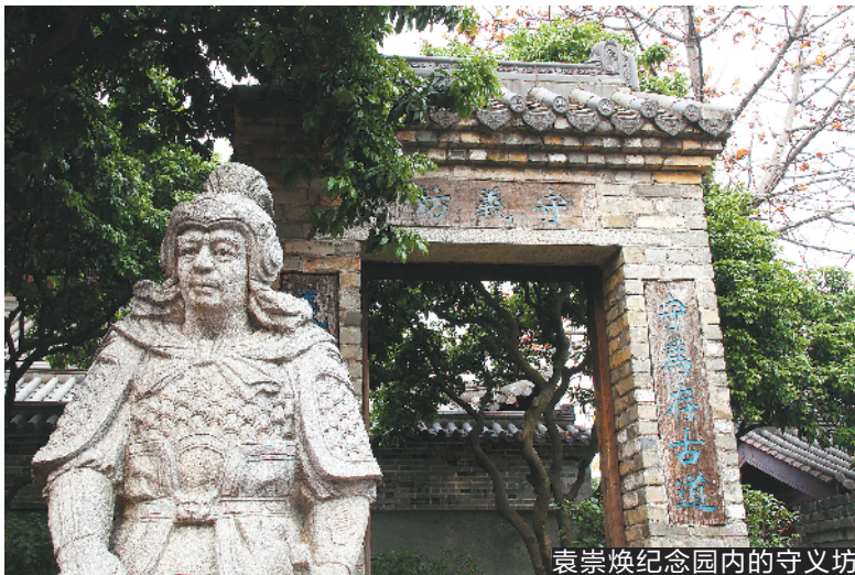
袁崇焕纪念园内的守义坊

10月30日,武侠小说泰斗金庸逝世,享年94岁。金庸笔下创作了多部脍炙人口的武侠小说,包括《射雕英雄传》、《神雕侠侣》、《倚天屠龙记》、《天龙八部》、《鹿鼎记》等。10月31日,记者获悉,金庸与东莞石碣曾有一段渊源,金庸曾为位于石碣镇的袁崇焕纪念园题写“崇焕故园”的书法条幅。10月31日上午,记者专程来到袁崇焕纪念园,目睹了金庸的书法真迹。