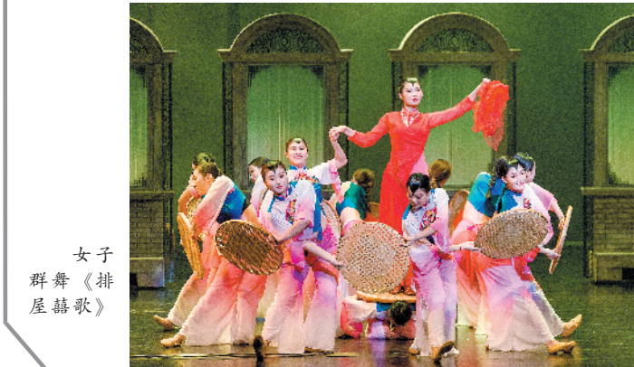
女子群舞《排屋情歌》