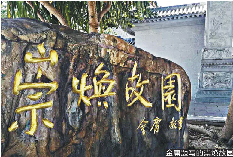
金庸题写的崇焕故园