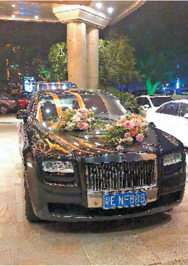
执行人员等待婚宴结束后再实施扣押