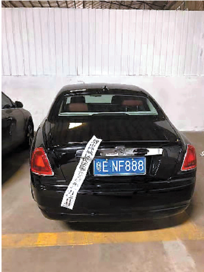
被查封的劳斯莱斯

对于能够支撑带动我镇产业跨越发展的龙头型、旗舰型重大项目,实行一事一议,不受2500万元封顶限制。