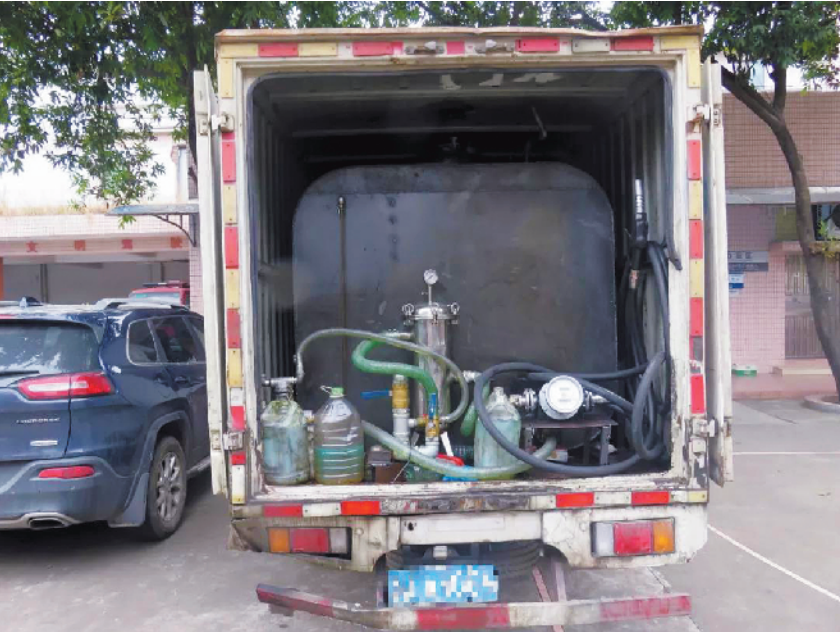
易某改装后用来兜售柴油的小货车

禅城城市综合管理局相关负责人表示,从 11 月 26 日起,禅城区开展为期一月的“铁拳 9 号”村民违建建房专项整治行动,重点打击在建设超高、拒不整改、顶风抢建的村民违建建房,在此提醒广大村民依法依规建房。