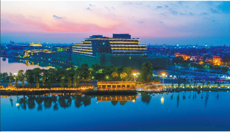
西樵观心小镇正如火如荼建设

此外,在周边配套上,听音湖片区作为西樵山岭南文旅RBD的核心区域,环湖的核心景观已经靓丽呈现;今年3月动工的宋城·西樵山岭南千古情景区项目总投资额达16.8亿元,预计2020年开业。除此之外,樵山文化中心以及定位为“南中国武术中心”的飞鸿馆力争明年上半年启用,并将云影琼楼和白云楼改造为特色精品酒店。