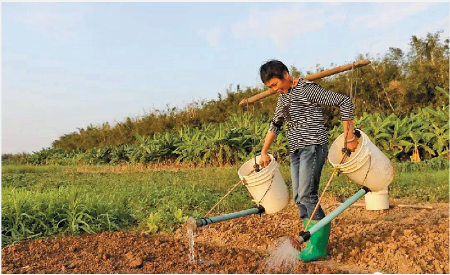
海寿岛上耕种的村民