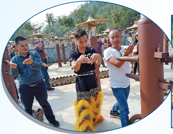
在木桩林公园练拳的群众