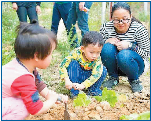
学生团体到营地认识蔬菜