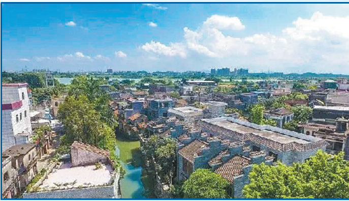
枕水而居的村居形态

西江河畔，佛山一环南延线上有个远离都市的滨江渔村，河涌碧波荡漾，巷陌古屋静谧。它就是顺德马东村。这里是永春故里，村里3000多名常住人口，几乎个个都会“永春拳”。历史文化底蕴深厚的马东村也是佛山市“五好”新村居，拥有多个响当当的“名号”。