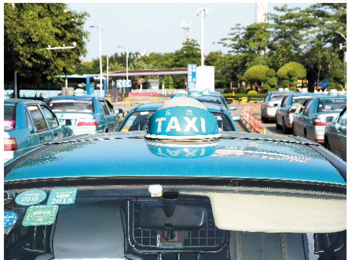
将采用“互联网+”执法