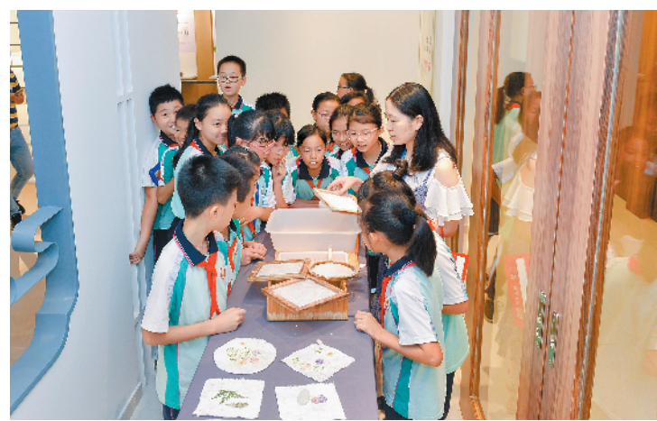
中小學生在博物館里體驗古法造纸