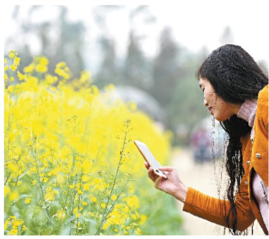
香蕉研究所的油菜花吸引不少市民前来赏花

该负责人称，此前有引种来自云南的油菜花品种，但是因为植株较矮、不整齐，不利于观赏，这两年就新引种了湖南、湖北一带的新品种。目前来看，植株发芽、高度、长势还是不错的。