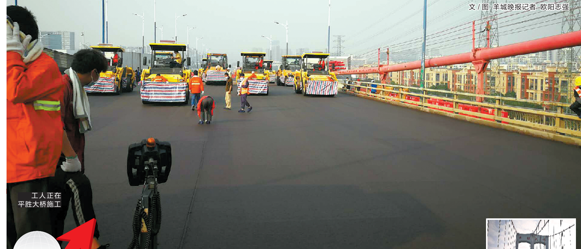
工人正在平胜大桥施工