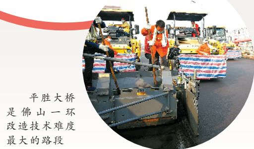
平胜大桥是佛山一环改造技术难度最大的路段

近日，记者从广东省人民政府网、广东省交通运输厅获悉，佛山一环改造段14处收费站已获批。根据工期进程，佛山一环主线争取于2019年春节前建成通车。