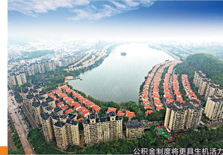
公积金制度将更具生机活力

和自助服务一体机外),住房公积金服务窗口(包括中心各办事处及各受委托银行住房公积金服务网点)仅提供咨询服务,2019年1月2日(星期三)恢复正常办理业务。