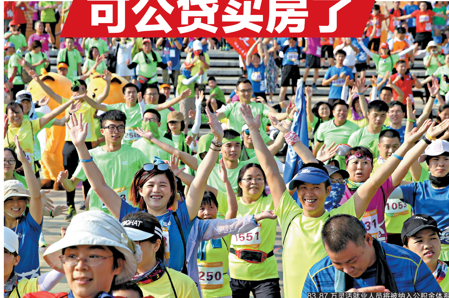
83.87万灵活就业人员将被纳入公积金体系