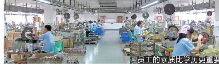
员工的素质比学历更重要

生产区及生活区庭院内花木茂盛、绿树成荫,道路、停车场、篮球场、游泳馆、车间、食堂、宿舍、下棋区等分布得井井有条;草木穿插其间,石桌、石凳、石制棋盘整洁如新,楼道栏杆纤尘不染。走进仟贸电机(东莞)有限公司,恍如走进了公园,而这里实际是一家智能制造精密电机和电子产品的企业。