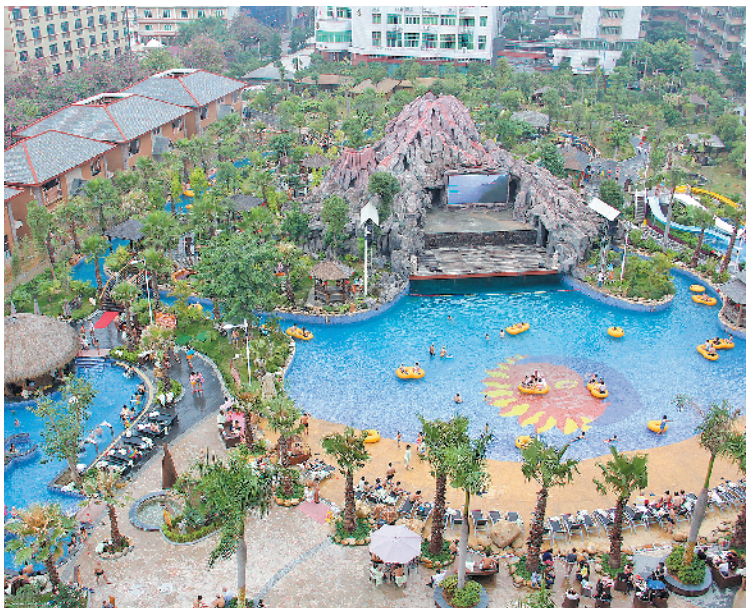
丰顺县“温泉游”日渐红火

羊城晚报讯 记者赵映光、通讯员胡金辉摄影报道：根据中央气象台预测，实力不凡的“冷空气”正在大举南下，元旦假期广东全省或将迎来最低只有6℃的湿冷天气。“湿冷模式”下，人们外出旅游的欲望必将大打折扣，但可以预见的是，“泡温泉”绝对会是一个例外，而有着“中国温泉之城”美誉的梅州市丰顺县，也必将是粤东地区市民出行“泡汤”的热门之选。