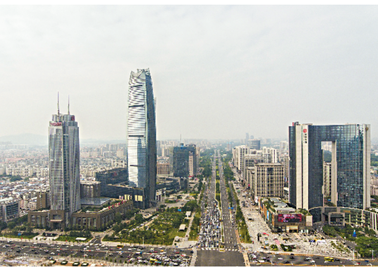
东莞召开市委全会，描绘城市发展蓝图