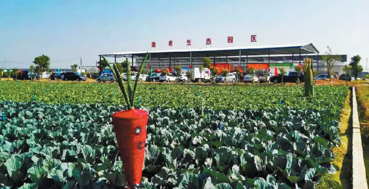
媲美大学环境的800余亩田园风光