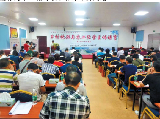
成立3年多已经培训超1万人次