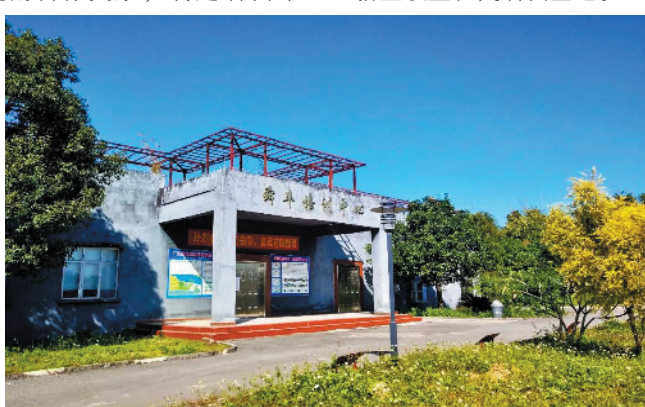
职业农民培训学校

目前,佛山共有1个全国新型职业农民培育示范基地,14个广东省新型职业农民培育示范基地(含综合类、实训类、创业孵化类),40个佛山市新型职业农民培训基地。