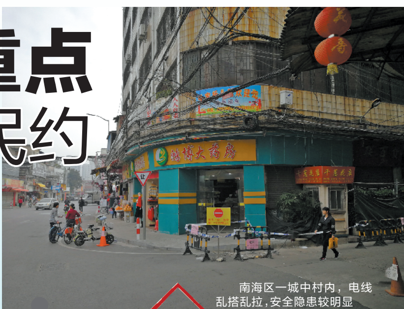
南海区一城中村内,电线乱搭乱拉,安全隐患较明显

而在河边地带,部分河道周边违章建筑未能得到完全拆除,对沿线生态和市容市貌造成影响。