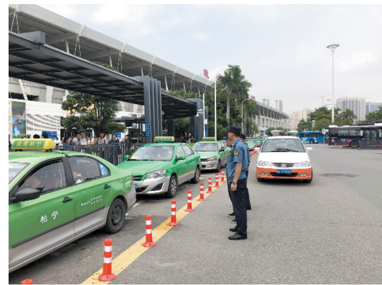
交通执法人员正在现场执法

在珠海做什么工作“有钱途”？智联招聘发布数据显示，珠海去年冬季求职平均薪酬为7163元，整体水平略有上升。 文/图 羊城晚报记者 钱瑜 在珠海做什么工作“有钱途”？哪些工作竞争压力大？1月8日，羊城晚报记者获悉，2018年冬季，智联招聘持续监测全国37个主要城市的职场竞争态势，根据平台大数据，结合在线企业招聘需求及求职者投递简历情况，分析得出《2018年冬季中国雇主需求与白领人才供给报告》，其中，珠海地区竞争指数10.1，排名第33位。(备注：北京竞争指数89.4，排名第一；广州竞争指数23.5，排名第13。)