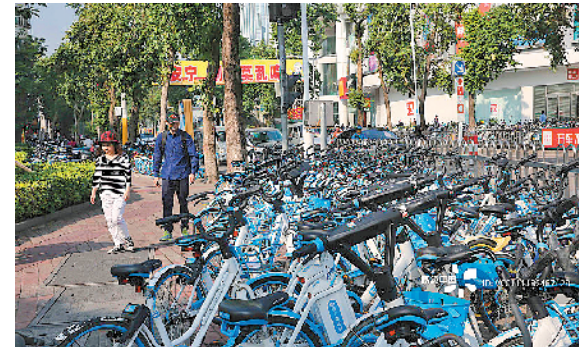
广东中山假日广场附近，共享单车车停满路边

羊城晚报讯 记者林翎、实习生黄镁纯报道：羊城晚报记者8日获悉，《中山市人民政府办公室关于规范共享单车管理服务的指导意见》(以下简称《意见》)日前正式出台。《意见》提出，结合城市发展规划、道路通行条件、骑行安全等因素，中山市不鼓励发展共享电动自行车。《意见》还规定，企业退出运营前要向社会公示，及时退还用户押金及预存金，完成所有车辆回收等工作。