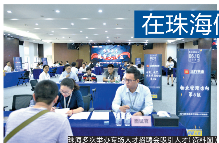
珠海多次举办专场人才招聘会吸引人才(资料图)

在检查中，也发现了一些问题，如部分建设单位没有按合同约定及时拨付施工总承包单位工程款，施工单位未足额支付工人工资或拖欠工资等。 珠海市住建局相关负责人表示，下一步将按照“有黑扫黑、有恶除恶、有乱治乱”的要求和“双随机、一公开”原则加强对辖区项目的建筑市场行为监督检查，有效遏制违法分包、转包、违法分包及挂靠等违法违规行为。对实名制管理落实不到位、分账管理落实不到位、管理人员履职不到位、未落实与农民工签订劳动合同和已发出《建筑市场执法检查整改通知书》的工程项目，各住建局要立即督促各责任单位组织整改，列为日常重点监管对象，加大检查频次，对整改不到位或拒不整改的企业录入企业诚信档案，并全市通报。