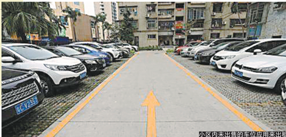
小区内未出售的车位应用来出租

3月14日，羊城晚报记者从珠海市住房和城乡建设局获悉，珠海市政府日前正式印发的《珠海经济特区物业管理条例实施细则》今日起正式实施，将为物业管理活动中存在的一些焦点、热点问题提供相应的解决依据，将进一步建立健全珠海物业管理长效机制。