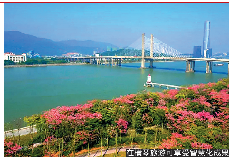
在横琴旅游可享受智慧化成果

此外，《实施细则》提出，物业服务合同权利义务终止后，业主委员会或者行业委员会职责的其他机构要求物业服务企业退出物业管理区域并移交相关资料，物业服务企业拒绝退出、移交资料，并以存在事实物业服务关系为由要求业主支付物业服务费的，业主有权拒绝。