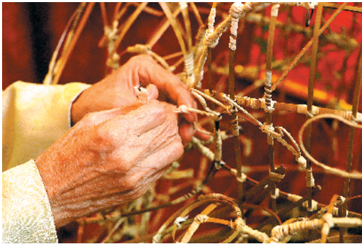
黎伟扎狮头手部特写