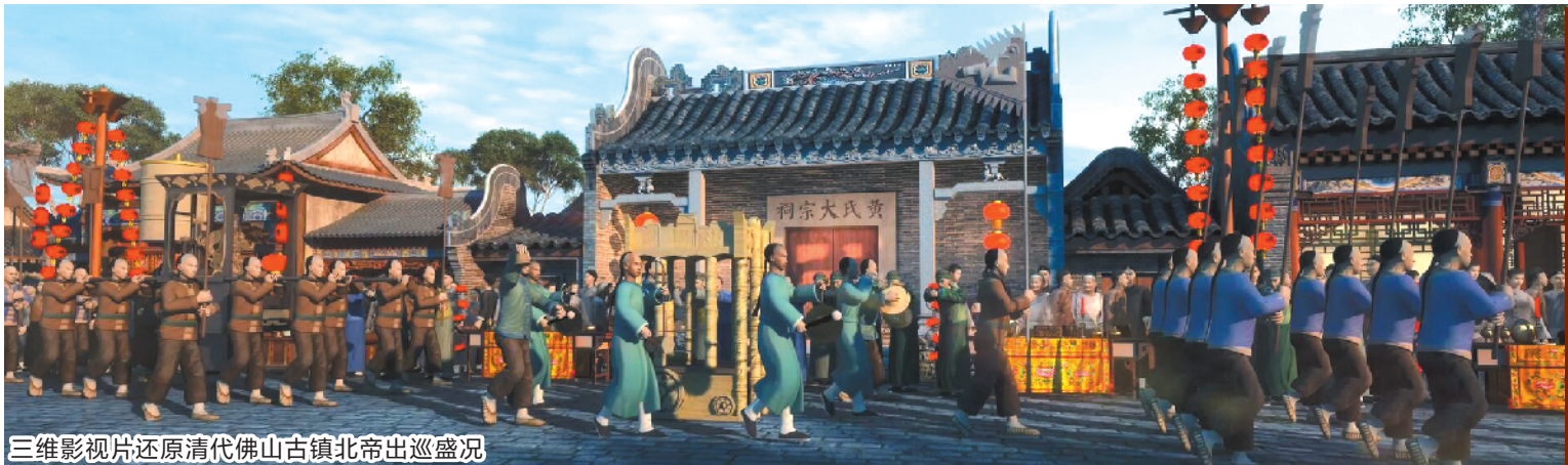
三维影视片还原清代佛山古镇北帝出巡盛况

据悉,佛山祖庙庙会(“三月三”北帝诞)是岭南一大民俗盛事,延绵数百年,是佛山民俗文化的缩影,更是佛山历史发展变迁的重要社会现象。北帝出巡是北帝崇拜的集中呈现,自明初开始,清代达至巅峰,盛况空前。今年出巡队伍依然阵容鼎盛:北帝