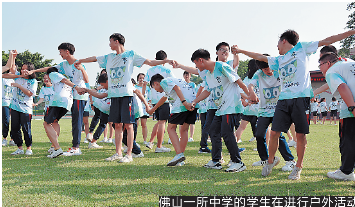
佛山一所中学的学生在进行户外活动