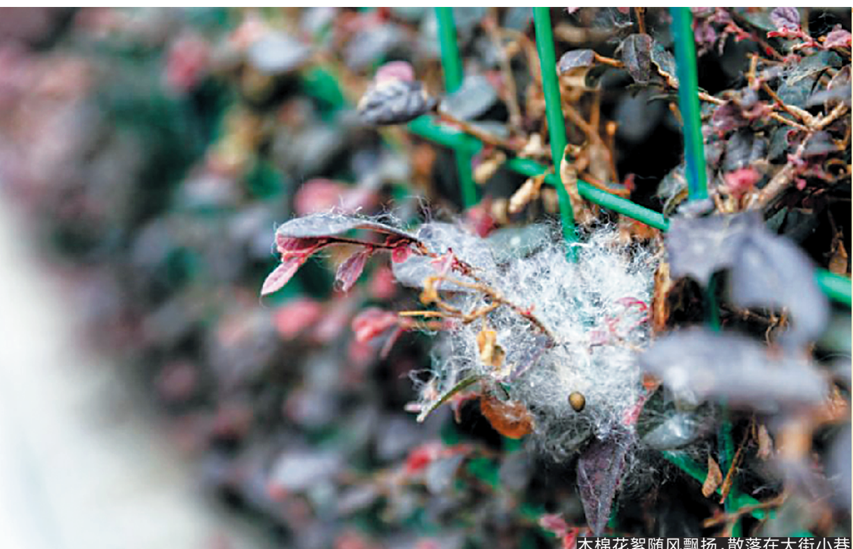
木棉花絮随风飘扬,散落在大街小巷

佛山禅城公安提醒市民,遇到陌生电话,即使听起来像熟人,也不要一下子就轻信对方所说的任何话,尤其在对方要求转账汇款时,市民务必第一时间多方核实对方身份,方可作出下一步动作。另外,嫖娼并不属于刑事案件,没有取保候审缴纳保证金这一流程,因此,提出嫖娼被抓需要缴纳保证金的均为骗子。