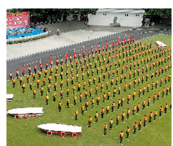
600 名武警官兵集结到位

据悉,该突击队坚持 24 小时值班备勤,一旦接到洪涝险情报警,将在 20 分钟内完成集结,60 分钟内到达灾害发生区域并开展抢险救援。记者在授旗仪式