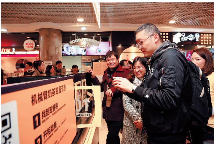
智慧餐厅内消费者手机自助取餐