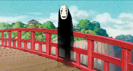
片中的无脸男也有拥趸

这是一部真正意义上的“合家欢”，所有年龄层的观众都能从中找到适合自己人生阶段的“关键词”：孩子看到的善良、青年人看到的勇敢、中年人看到的初心。相对应的，千寻、白龙、无脸男等各个角色，都有自己的拥趸。当然，人们还能从中看到更多，例如对现代社会的批判和反思，包括对金钱和食物的贪念，等等。