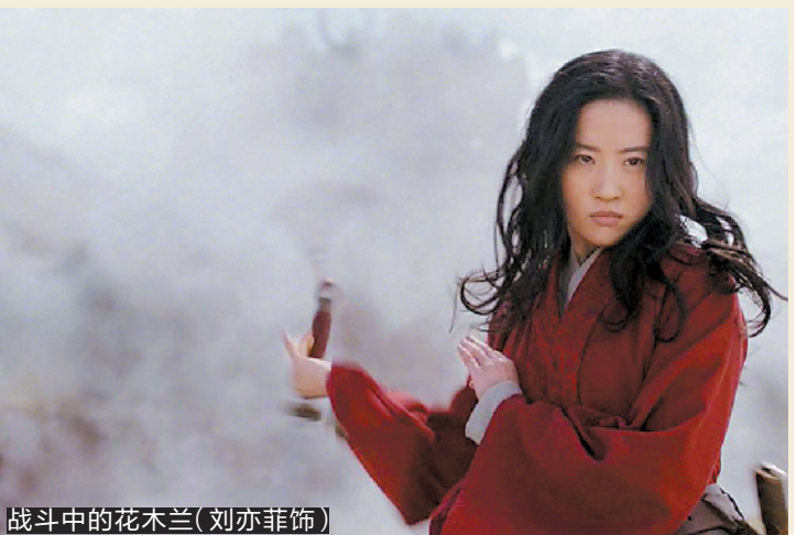
战斗中的花木兰(刘亦菲饰)

对于中国影迷来说，如何看待《花木兰》也是件令人纠结的事。一部分人表示：“只要故事拍得好看就行，毕竟不是中国人当导演，不要太奢求。”也有人坚持认为：“《花木兰》是中国传统文化宝藏，要拍就得认真考据不能瞎糟蹋。”