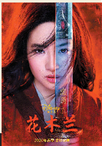
《花木兰》海报颇有东方韵味