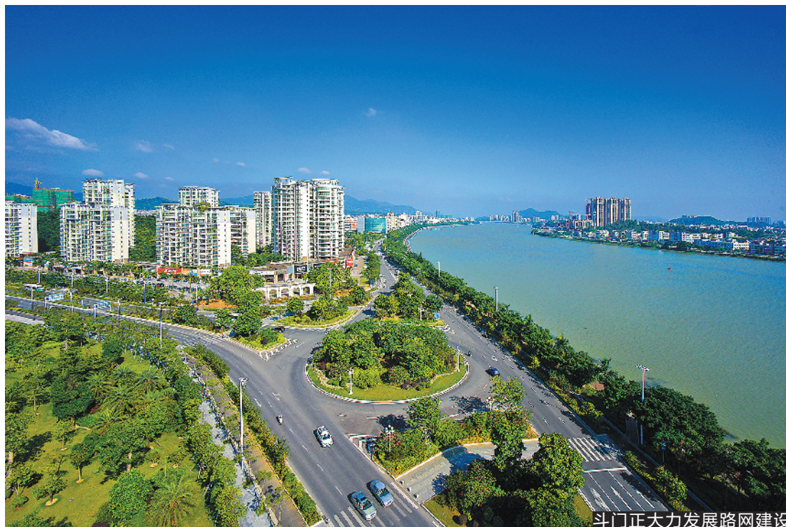
斗门正大力发展路网建设

门港的发展，斗门“海陆空”立体化综合交通运输系统雏形初现。 但是，大型交通基础设施项目建设容易面临资金、征地拆迁甚至涉及跨地区合作等诸多因素制约，因循守旧、墨守成规往往难有出路，机场北路北延线项目多年来止步不前就是最明显的例子。 为加快项目推进落实，斗门区交通主管部门相关负责人称，斗门下一阶段将探索建立新的投融资模式，把项目建设与城市更新、道路沿线土地开发融为一体、相互促进，形成良性互动。对于涉及跨地区合作的交通基建项目，比如县道X581东延线、X584六乡大道东西连接线以及斗门大桥改扩建等项目，下一步需在现有珠中江三地合作平台基础上，进一步探索珠海市与中山、江门两市之间新的合作机制，加快相关项目的推进实施。