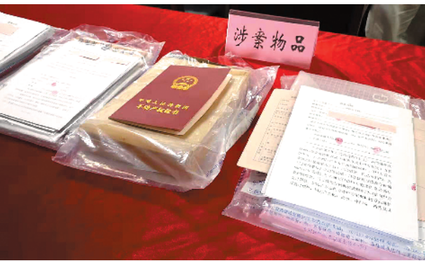
珠海警方缴获的涉案物品

珠海有位市民因为手头紧,掉入了“套路贷款”的陷阱。在几年时间里,不仅借款越来越多,还损失了自家房子。羊城晚报记者获悉,这个“套路贷款”团伙近日被珠海警方抓获。经侦查发现,掉入“套路贷款”陷阱的珠海市民还有不少。目前案件还在继续深挖当中。