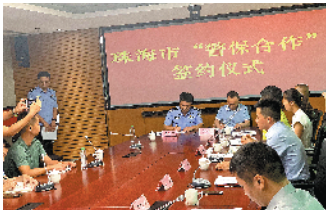
珠海交警支队与三家保险公司签订相关合作协议

为进一步加强“警保合作”工作,强化农村交通安全宣传教育,提升“警保合作”社会关注度,7月17日下午,珠海交警支队与市人保财险、平安财险、太平洋财险三家保险公司就“警保合作”参与农村交通安全管理工作签订相关合作协议。珠海市银保监局、市公安局交警支队及市人保财险、平安财险、太平洋财险的领导参加了签约仪式。今后,珠海市将建立交警、保险部门工作联络机制。根据协定相关约定,珠海市农村“两站两员”共建工作分两个阶段进行,第一阶段:在今年7月底前,按照劝导站建设相关标准,率先完成乾西村一级劝导站和三板村二级劝导站的建设工作,形成可复制、可推广的农村劝导站样板;第二阶段:在今年11月底前,对全市114个农村劝导站建设工作进行实地查勘定点,按照第一阶段劝导站建设样板,完善相关设施,固化工作机制,推进“警保合作”劝导站在珠海市农村地区的全覆盖。在经费保障方面,警保合作劝导站的建设、软硬件设施的维护以及劝导员的薪酬补贴等经费,由承保保险公司提供保障;斗门、金湾、高栏港交警大队要协调指导保险