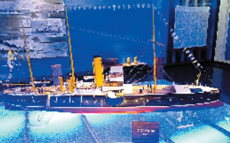
林国祥曾担任管带的广乙号鱼雷巡洋舰模型

今年7月25日，是中日甲午战争爆发125周年。125年前的7月25日，朝鲜牙山湾口丰岛西南海域，由广东水师驰援北洋水师的“广乙”号鱼雷巡洋舰，不惧火力与吨位的劣势，挑战“浪速”“秋津洲”“吉野”三艘日舰。而该舰管带（舰长），正是祖籍新会大泽的著名华侨海军将领林国祥。