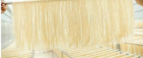
恩平濠粉年产1500吨

羊城晚报讯 记者陈卓栋、通讯员谭耀广报道：记者23日获悉，日前恩平市、广东省农产品质量安全中心联合邀请中国水稻研究所、中国农科院、广东省农科院专家一行，前往恩平市开展“恩平大米”“恩平濠粉”国家农产品地理标志评审考核工作。这是恩平市继“恩平濠菜”后，又一次为当地农产品申报“国字号”地理标志。