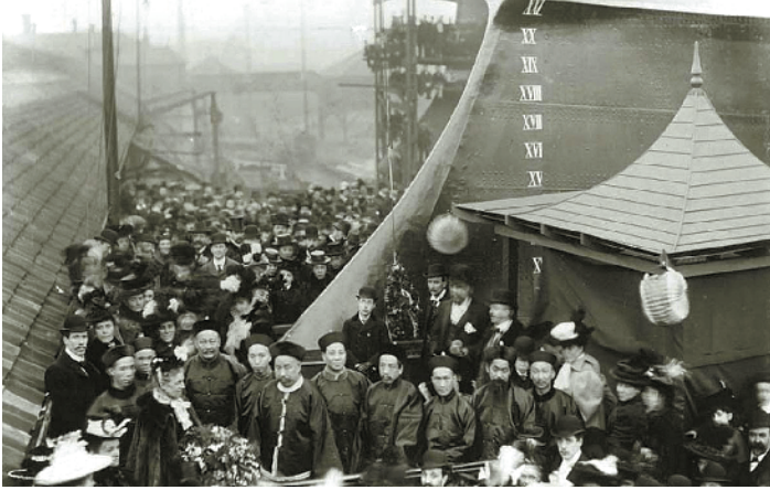
1898年海圻号下水仪式中，前往英国监督造舰的林国祥（前排花束正后方者）

日前，在新会区大泽镇北洋村委会附近，记者见到了一座门口挂牌“林国祥故居”的两层村屋。北洋村委会工作人员告诉记者，这座屋子归林国祥的亲属所有，“前几年新会文物局的人来拍过照”。据悉，林国祥的亲属现在散居深圳、香港等地，“很久没有回来了”。