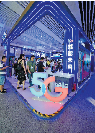
深圳5G体验周中国电信展区一角

在优化环境上，园山基本实现辖区水体不黑不臭，建立《园山街道重点水体巡查体系，全面推行湖长制，实行“互联网+河长制”，采取“拉条挂账，逐个销号”的管理手段，全力推进消除黑臭水体治理工程，完成了辖区第一阶段水环境、水安全整体形象进度的98%。