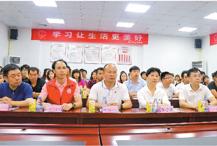
7月4日，宝安区区长郭子平来到沙井与市民一同上“宝安第一课”

来了就是宝安人，来了就上“宝安第一课”。为推动现代化社区治理体系建设，提升市民综合素质，目前，宝安区全面推动“宝安第一课”常态化培训。据统计，从年初到7月份，“宝安第一课”累计培训超过34万人次。据介绍，沙井街道丰富多样、深入群众的课程深受居民欢迎。