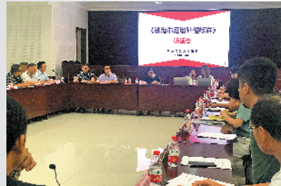
珠海举行征地补偿标准听证会

珠海计划提高征地补偿标准,最高或可达每亩11.8万元。8月6日,《珠海市征地补偿标准》听证会在珠海市自然资源局举行。据介绍,《珠海市征地补偿标准》(征求意见稿)(以下简称《标准》)意在完善珠海市征地补偿安置政策体系,解决珠海市征地补偿标准偏低的问题。