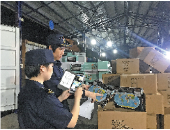
海关查获“问题地图”