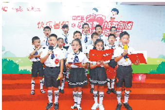
来深“小候鸟”的集体诗朗诵

8月16日,肯德基小候鸟诗歌朗诵训练营圆满结束。在为期4天的朗诵训练营中,来自湖南、四川、湖北、广东惠州等地的15名“小候鸟”在民治街道白石龙社区党群服务中心跟随专业