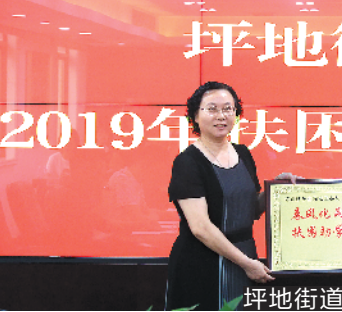
坪地街道开展2019年“扶困助学”活动

据了解,该街道已经连续12年举办此项活动,帮助许多困难家庭子女圆了学业梦。活动现场,根据不同家庭情况和考上大学的类