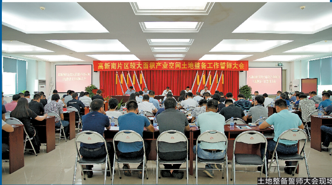
土地整备誓师大会现场