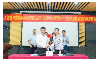
深圳人工智能与数据科学研究院落户龙华区

深圳人工智能与数据科学研究院(龙华)是由中国科学院自动化研究所与深圳市龙华区人民政府共同建立的新型研发机构。研究院将在智能制造、智能服装新零售、智慧养老大