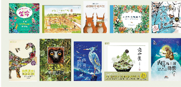
2018 大鹏自然童书奖“十大自然童书”书单

日前,由深圳读书月组委会和大鹏新区综合办公室主办的2019大鹏自然童书奖正式启动。2019大鹏自然童书奖以“多样的生命”为主题,开展年度自然童书评选活动。本届大奖征集范围为2018年1月1日至2019年8月31日期间,在中国内地面向儿童出版的,以自然生态为主题的图书作品。首发征集活动时间为8月16日至9月20日。