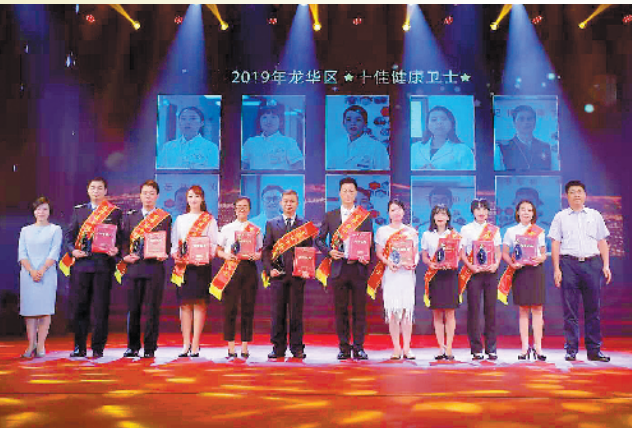
龙华医疗界的杰出代表们

19日,龙华区举行了第二届“中国医师节”庆祝活动。当天,龙华区“十佳专科医生”“十佳家庭医生”“十佳健康卫士”“医患和谐团队”等奖项集体出炉。