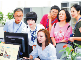
受邀代表体验验证业务

8月20日,由龙岗区政务服务数据管理局主办的“请您看·听您说”——龙岗区行政服务大厅第二届“政务服务开放日”活动举行。活动邀请民主党派代表、人大代表、政协委员代表及群众代表共计15名代表“零距离”参观体验、“手把手”模拟预约、“面对面”交流座谈。