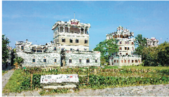
开平自力村碉楼群图

据介绍，汀江华侨文化走廊由台山广府人出洋第一港、南粤古驿道示范段海口埠，《让子弹飞》拍摄地梅家大院等华侨文化建筑构成；开平世遗文化经典游主要包括开平碉楼与村落两大世遗元素，目前已经成为江门吸引外地游客的主要景点；鹤山红色文化两天游包括龙口粉洞知青农场、雅瑶宋氏大宗祠、址山云乡抗日部队司令部张怀楼、广东人民抗日解