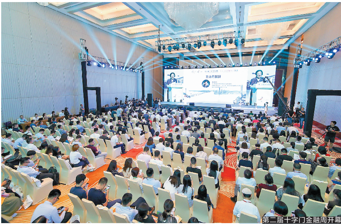
第二届十字门金融周开幕