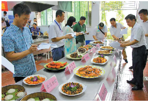
评审们对参赛菜品进行打分

羊城晚报讯 记者陈卓栋、通讯员江人宣、谭耀广报道：记者20日从江门市人社局获悉，近日，台山市开展了2019年“粤菜师傅”创业之星评比活动，12名台山本地“粤菜师傅”培训班自主创业学员外出观摩交流、创业辅导交流，以及举行台山特色名菜比赛。据了解，下一步台山将精准落实创业一次性资助、租金补贴等优惠政策，扶持台山市“粤菜师傅”打造台山本地特色餐饮名店，以助推乡村振兴发展。