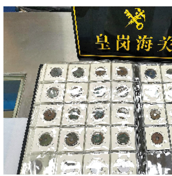
皇岗海关查获的疑似文物古钱币

羊城晚报讯 记者宋王群,通讯员陈人铭、刘昊然摄影报道:8月21日,记者从深圳海关获悉,15日,该关所属皇岗海关在皇岗口岸出境大厅,查获一名出境旅客违规携带未向海关申报的疑似文物古钱币184枚。目前,案件已移交海关缉私部门调查处理。 当日21时30分,一名中年男子从皇岗口岸出境大厅出境,其行李的X光机图像引起了现场关员注意,遂依法对其行李进行开箱查验。经查验,现场关员在该名旅客行李内查获一本装有多枚钱币的纪念册,钱币上铸有“康熙通宝”“开元通宝”等字样。该名旅客自称购买该批钱币用于收藏,但不能提供合法携带这批钱币出境的相关证明文件。