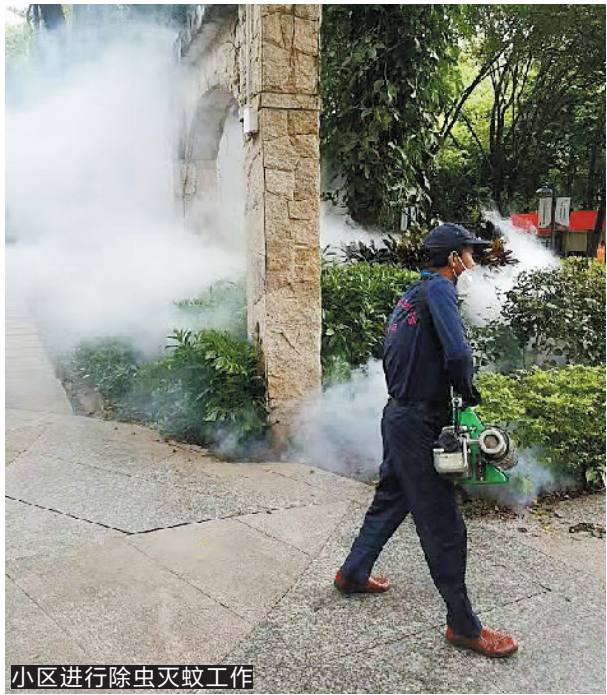
小区进行除虫灭蚊工作

羊城晚报讯 记者王俊、通讯员深疾控摄影报道:当前广东已进入登革热流行季,珠三角多个地市已报告本地散发病例。记者8月21日从深圳市疾控中心获悉,8月8日至9月4日深圳登革热指数为Ⅱ级,提示深圳本市登革热感染风险较高。 据广东省卫健委通报,今年截至6月12日,广东省18个地市——共报告了240例登革热病例,比去年同期(44例)大幅上升。有231例境外感染输入病例,其中54例在深圳发现,有9例是本地感染病例,出现在广州、佛山、江门、中山、珠海5市。 “传播登革热病毒的是蚊子家族中的伊蚊(包括埃及伊蚊和白纹伊蚊),而在深圳活动的主要是白纹伊蚊,俗称花斑蚊。”深圳市疾控中心介绍,8月1日至15日,深圳市疾控中心通过对全市419个监测点进行伊蚊密度监测,发现深圳蚊媒密度总体较高,不符合防控要求的监测