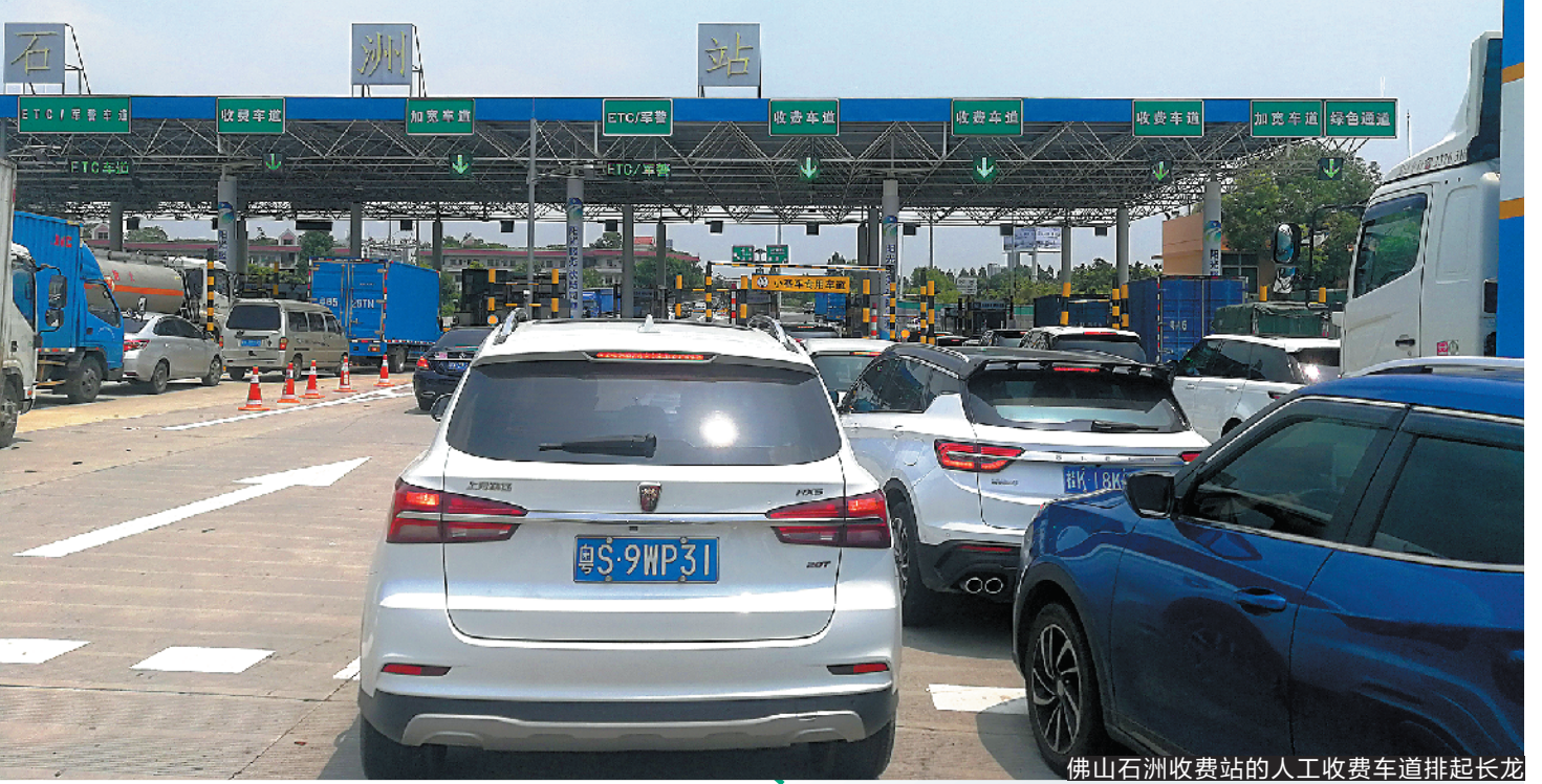
佛山石洲收费站的人工收费车道排起长龙

如此庞大的支付市场，各大银行、支付机构跃跃欲试。佛山提供了中行、工行、农行、建行、交行和邮储等六大银行的营业网点办理，目前全市共有 700 多家银行网点可现场办理。 记者了解到，佛山六大银行均推出 ETC 线上一站式服务，无需去网点或高速服务站，在线完成申请，设备送上门。 各大银行的差异化在于 ETC 信用卡的大礼包。其中，中国农业银行的大礼包，涵盖了通行费 7.8 折、1 元洗车、可获 50 元的电子购物卡等，目前 ETC 日均办理量在 4000-5000，为佛山 6 大行中办理 ETC 数量最多的；而中国银行则推出通行费阶段性折扣，最低可达 8 折、加油满 200 减 50 元等 12 项礼包。 中国建设银行则