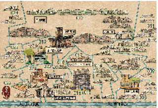
大和村全貌手绘地图