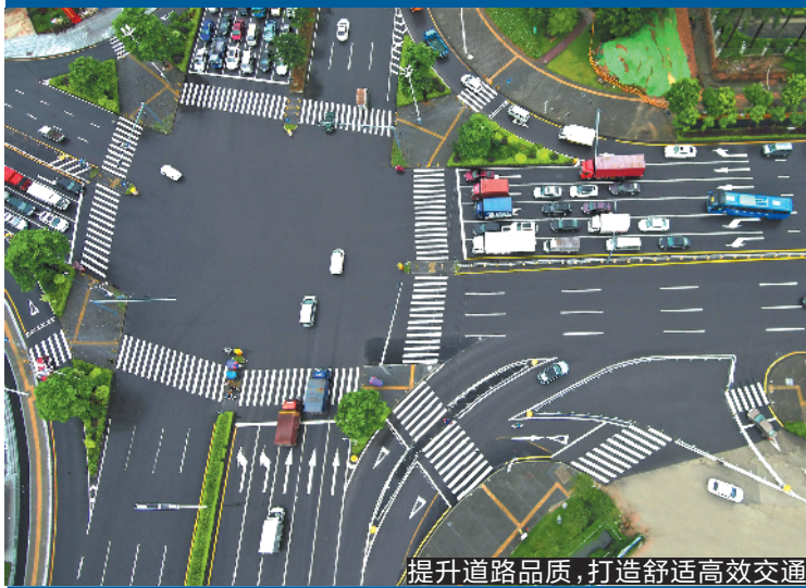
提升道路品质,打造舒适高效交通

8月22日，光明区2019年第二场新闻发布会举行。发布会上公布了扫黑除恶专项斗争成果、道路交通建设、城中村综合治理成果、区政府投资工程建设和科学城重点片区建设的相关情况。