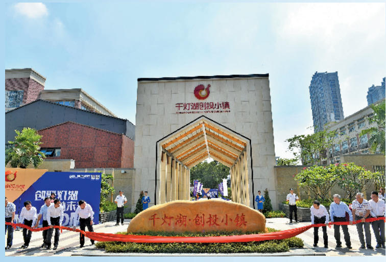
千灯湖创投小镇正式揭幕

岭南风格的门楼、现代风格的独栋办公楼、美式学院风格的金融展示中心、蜿蜒的小河、葱郁的树木……8月28日,位于佛山南海的千灯湖创投小镇开园亮相,改造后的小镇核心区揭开神秘面纱。