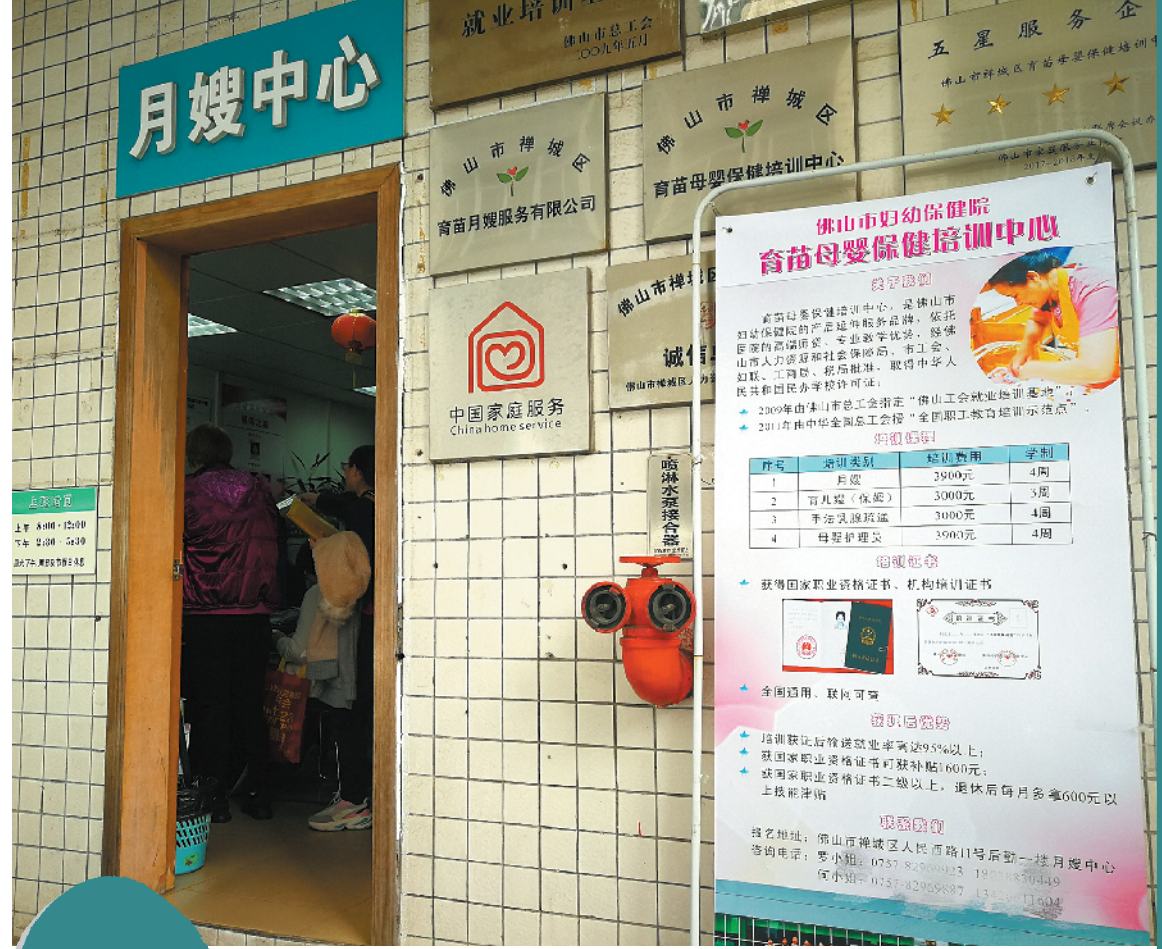
位于佛山禅城的一家月嫂中心

工院校设置养老服务相关专业或开设相关课程,推进技工院校养老服务实训基地建设,培养养老服务专业人才。到2021年,全市组织开展养老护理员培训3000人次。医疗护理服务培训方面,鼓励有条件的技工院校、培训机构、医疗机构、社会组织等,积极开展医疗护理员培训。到2021年,全市组织开展医疗护理员培训3000人次。 据悉,佛山将以佛山市技师学院为载体,创新打造立足佛山、领先华南、服务湾区的高端家政培训学院,培养建立一支高素质、高技能的家政服务技能人才队伍。