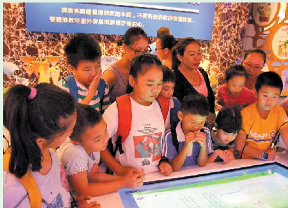
孩子们在认真学习中

暑假期间,观澜街道组织辖区 10 个社区集中开展反邪教主题宣传活动,在宣传点派发反邪教宣传传单,还设立有奖问答区域,派发印有反邪教标语的宣传品。此外,充分利用社区公共场所的 LED 屏幕、社区微信工作群等方式扩大反邪教宣传范围。(王志钰 王俊 郭霜霜)