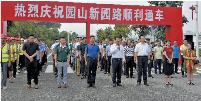
新园路如期完成打通任务

于 2009 年开工,原计划 2010 年完工。其中 1 公里长的一标段工程在 2013 年完成了 750 米路段建设后,因拆迁原因形成了约 250 米长的断头路。按照打通龙岗区断头路总体工作部署,将园山新园路建设列入龙岗区打通“断头路”三年行动计划(2019-2021)之一。通过各方不懈努力,新立项的新园路南延段工程于 2019 年 4 月 15 日开工建设,最终按期完成打通任务。(蔡鹏飞 徐怡)