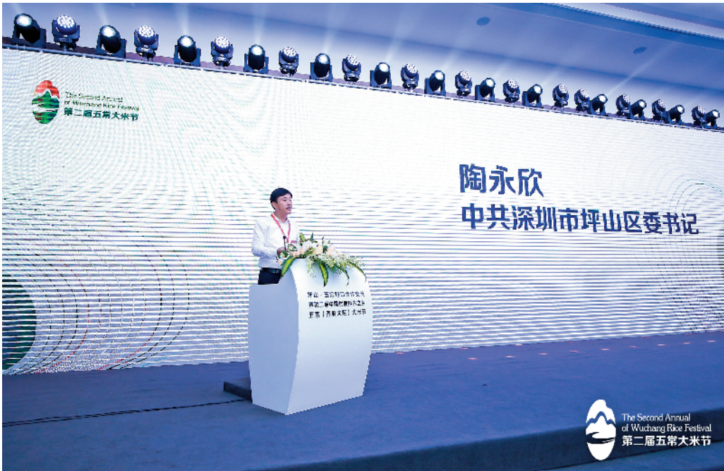
坪山区委书记陶永欣致辞