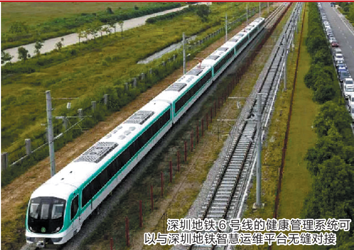
深圳地铁6号线的健康管理系统可以与深圳地铁智慧运维平台无缝对接

建设了大型的帆船、游艇港池,组建了青少年航海俱乐部,开展了一系列针对珠海以及粤港澳大湾区乃至整个广东、华南地区的帆船、航海活动,成为大湾区一个重要的航海运动基地。2016年至2018年,九洲控股集团有限公司与中航协倾力合作,组织全国帆船锦标赛、亚洲帆板锦标赛和亚洲风筝板锦标赛,主办珠海本土品牌“九州杯”帆船赛,还引进了国际级的克利伯环球帆船赛。在九洲控股集团有限公司和其他社会力量的积极推动下,帆船、游艇产业已经成为珠海市未来城市发展一项重要工程。