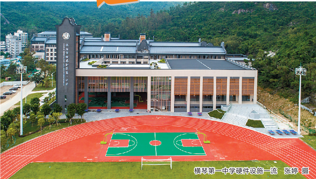
横琴第一中学硬件设施一流

从基础薄弱到高起点发展,横琴教育发展走出了一条“独特”的道路。2015年,珠海横琴首创“公办民管”模式,学生在横琴读书可享受“公办价格上‘贵族’学校”。今年9月,备受关注的首都师范大学横琴伯牙小学即将开学,这是横琴新区首试与全国“双一流”建设高校“联姻”办学。另外,哈罗礼德、威雅公学等知名国际学校也将落户横琴。