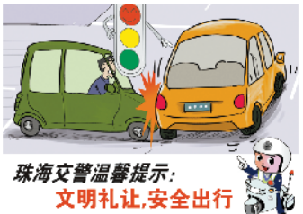
珠海交警温馨提示:文明礼让,安全出行

567辆车进入黑名单!今年以来,珠海交警持续开展“僵尸车”整治行动,共清理各类“僵尸车”289辆,对567辆未达到报废期限却长期停放车辆的车主,及时进行电话督促,要求车主尽快将车辆移走。对未及时移走的车辆,交警将强制拖移。