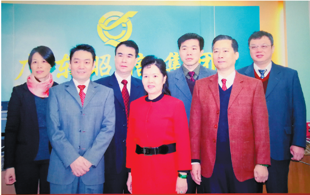
集团第一、第二届党委班子合照

1988年,面对加工企业利润微薄的现状,昭信再次在党组织的带领下突围。最终,公司与日本TDK签约了第一笔试生产合作业务,昭信平洲电子也正式拉开了与世界龙头企业TDK的合作序幕。