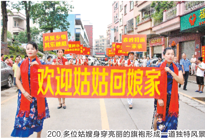
200多位姑嫂身穿亮丽的旗袍形成二道独特风景

羊城晚报讯 记者王俊伟、通讯员关摄影报道:“欢迎姑姑回娘家。”近日,东莞厚街赤岭社区祠前村举行首届姑嫂宴,200多位姑嫂身穿亮丽的旗袍,手撑黄纸伞,整齐地围绕社区的街巷、小公园、祠堂等漫步,形成一道如诗如画的独特风景。据了解,该姑嫂宴全由赤岭社区的姑嫂们自筹自导自演,得到了群众的一致好评。