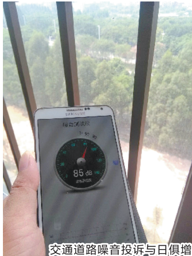
交通道路噪音投诉与日俱增

显增多,刚刚过去的2019年8月就达到62宗,投诉集中表现为工厂、餐馆、施工地、广场舞等商场食肆、交通要道及娱乐设备的噪音扰民。研究报告显示,2018年,东莞市全年噪声投诉共计8425起,投诉主要原因是噪声扰民问题。针对这些噪声投诉区域,今年1月,相关机构进行了声环境现状补充监测。监测结果显示,东莞市等效声级基本在45.0—79.1分贝之间。其中,昼间噪声等效声级为57.6分贝,夜间噪声等效声级为51.2分贝。东莞市昼间总体区域环境噪声一般,夜间总体区域环境噪声较差。