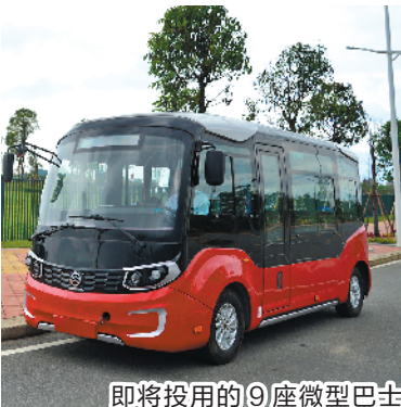
即将投用的9座微型巴士

值得注意的是,全市占地面积最多的为2类声环境功能区,根据相关标准,该功能区噪声等效声级限值昼间为60分贝,夜间为50分贝。