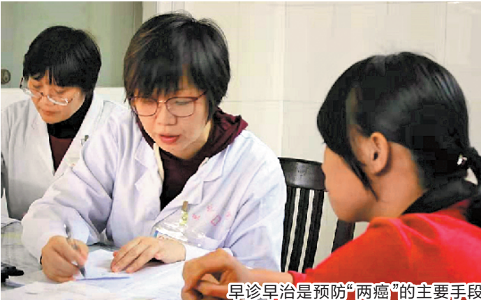
早诊早治是预防“两癌”的主要手段

“两癌”(宫颈癌、乳腺癌)作为威胁女性健康的两大杀手,发病率位居女性恶性肿瘤的前列。记者3日从东莞市卫生健康局获悉,《东莞市妇女宫颈癌、乳腺癌筛查项目实施方案》(以下简称《方案》)已经出台,今年将重启“两癌”免费筛查——除35—64岁的莞籍妇女外,筛查覆盖面扩大至在莞连续参加五年社保的非户籍妇女。