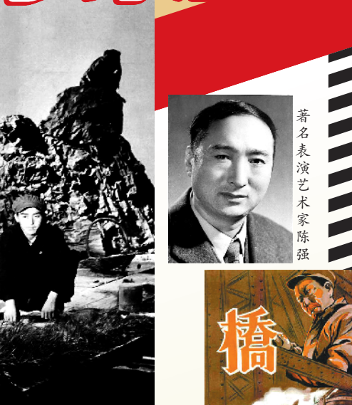
著名表演艺术家陈强

1949年5月1日,电影《桥》首映。其时,新中国还未正式成立,解放军在渡江战役中刚刚解放了南京,开始向苏南、浙东等地进军。《桥》所到之处,受到广大观众、特别是工人阶级的热烈欢迎。据陈强描述:“当时拍摄条件差,画面