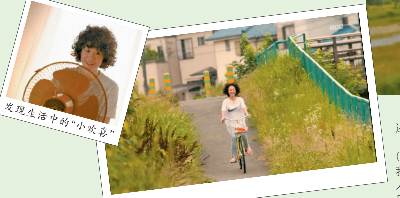
发现生活中的“小欢喜”