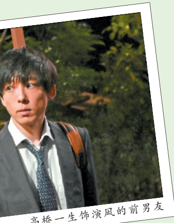
高桥一生饰演的前男友

“读空气”的奥义在于个人服从群体，个人必须时刻注意不要冒犯他人，不要破坏群体的气氛，相当于中文的“有眼力见”，这种能力在职场上尤为重要。