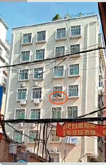
男童被卡的位置是5楼,当时情形十分危险