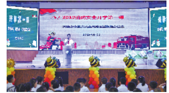
“2019年消防安全开学第一课”开课

课堂上,大鹏办事处火灾整治办负责人结合深圳最近发生的典型火灾案例,提醒师生们消防安全无小事,要牢记安全用火、用电的常识,掌握火灾报警电话,了解基本的火场逃