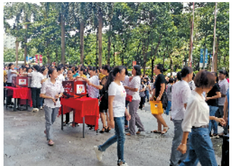
龙城街道辖区企业员工积极参与义捐活动

据了解,在龙城街道的引导动员下,辖区企业始终坚持践行企业家社会责任,在历年的扶贫济困活动中均有杰出表现。在2018年粤桂扶贫捐款活动中,龙城商会爱心企业共计捐出110万元爱心善款;在2019年龙城街道结对帮扶广西那坡县百省乡贫困村项目中,龙城街道各社区股份合作公司及商会爱心企业捐出帮扶资金及物资234.2万元(其中:红格股份合作公司20万元;盛平股份合作公司30万元;黄阁坑股份合作公司50万元;回龙埔股份合作公司50万元;爱