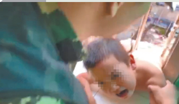
两岁男童得到巡查队员及时相救