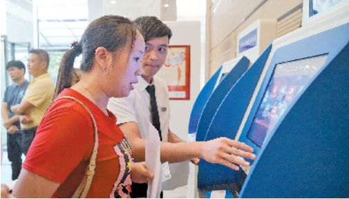
居民享受平湖街道行政服务新大厅的便捷服务